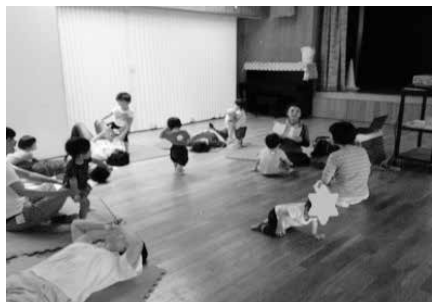
写真19 子育て支援0・1・2歳児 保育所