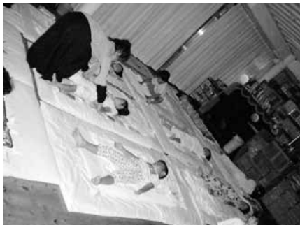
写真13 お泊り保育（就寝前）