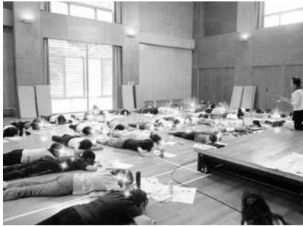
写真21 保育士会（Bパターン）

Cパターン：OJT（On-The-Job Training）の中での実践として行う形式である。保育者が時間を調整して集まる形をとり、まねまねヨーガの指導風景を保育者が実際に見聞し、そこで学んだ方法を自分のクラスにもちかえて実践するための研修として実施している。