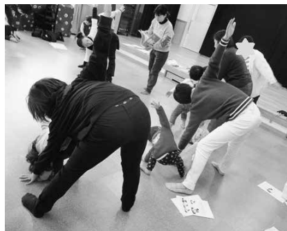
写真15 保護者参観 2歳