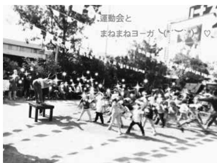
写真14 3、4、5歳とその保護者

運動会プログラム中盤のブレイクタイムで親子参加型のまねまねヨガを行う。CDをかけて「オットセイ」のポーズあたりまでで、カラダをしっかり伸ばし、その後、後半の競技に臨めるようにするという形で導入している（写真14）。