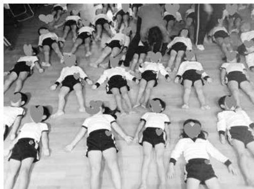
写真8 リラクゼーション（私立保育所）