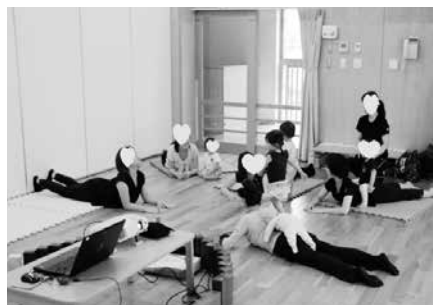
写真17 子育て支援0 1 2歳 保育所

Aパターン：子育て支援では主に絵本『まねまねヨーガ』の最終章におさめられているスキンシップ・ヨーガを実践するが、子どもが大好きな保護者