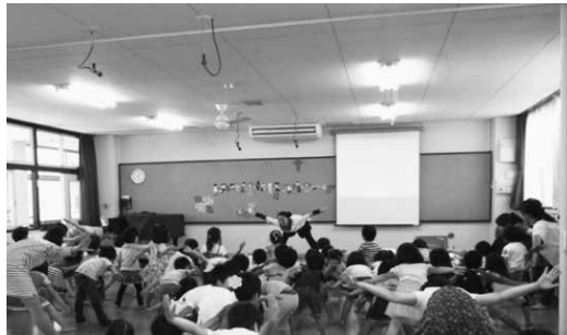
写真11 お帰り前ヨーガ4、5歳