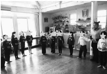
写真4 午前中の設定保育 (私立 幼稚園)

この園では3歳児の3月の保護者参観などで親子ヨーガを体験し、その翌年度から、年中児と年長児がクラスごとに定期的に約45分ずつヨーガの時間