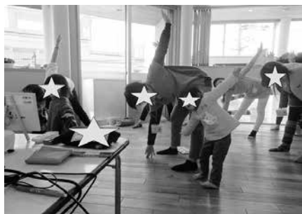
写真18 子育て支援0 1 2歳 幼稚園