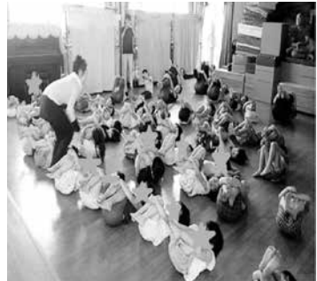
写真24 認定こども園 （Cパターン）

こうした保育研修後は「まねまねヨーガ」の時間をカリキュラムに取り入れ、「毎日少しの時間行っている」、「週に一度メインの活動として行っている」という報告、また、日々の「まねまねヨーガ」の姿を「生活発表会」にて保護者の前で実践したなどの報告を得ている。以下の記事からは、保育の中で「まねまねヨーガ」を単に実施するのではなく、「こどもの自己肯定感」の醸