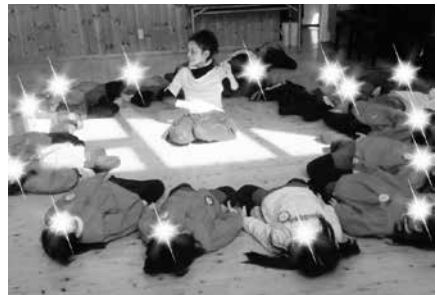
写真5 午前中の設定保育 (私立 幼稚園)