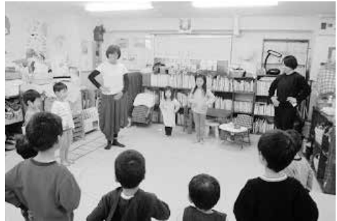
写真3 午睡前ヨーガ (公立保育所／認可外保育所)