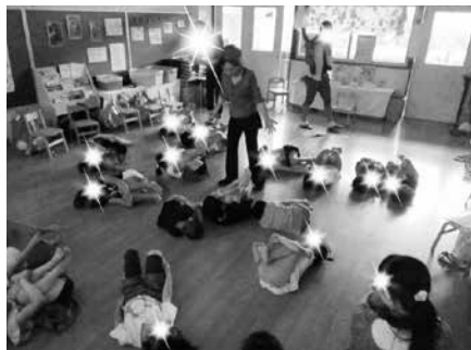
写真12 お泊り保育（夕食前）