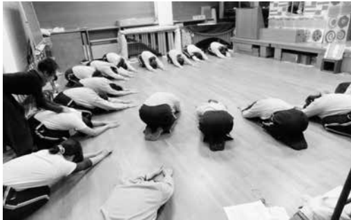
写真23 保育所（Aパターン）