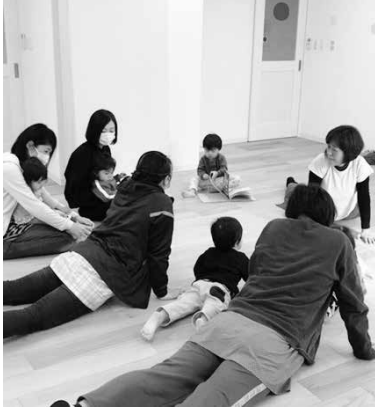
写真2 朝の会 企業主導型保育所

にあわせて、足の指回しがはじまる。次に「今日のリーダーさんはだれですか」という言葉で、リーダーが名乗りでると、追いかかわらべ歌ヨーガが開始される。最後は夢見のポーズで落ち着いてリラックス。その後一日の活動が開始されている（写真3）。