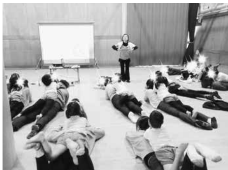
写真16 保護者参観 5歳