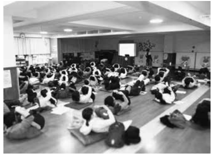
写真22 認定こども園（Bパターン）