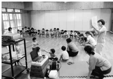
写真20 子育て支援0・1・2歳児と 5歳児との交流保育

に憧れ真似るという体験を推奨したいと、最後は子どもたちの前で親が楽しくヨガを行う姿をみせる形をとっている。およそ1歳半から2歳の子どもたちは、何等かの形で親をまねようとしてみせる。その姿を見て親は一層子どもを愛おしいと感じることができる様子や発言がある。