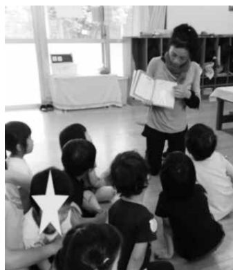
写真9 お帰り前ヨーガ3歳

3歳児にはクラスでの手遊びヨーガを行った後、CDで「まねまねヨーガで旅にしようよ」を行う。3歳児はその後お帰りの支度を始める。4、5、6歳はお帰り前の支度を終えた後、ホールで絵本『まねまねヨーガ』のスライドを観ながら全員で行う。リラクゼーションを含めて30分以内の実践である（写真9、10、11）。