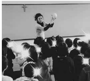
写真10 お帰り前ヨーガ